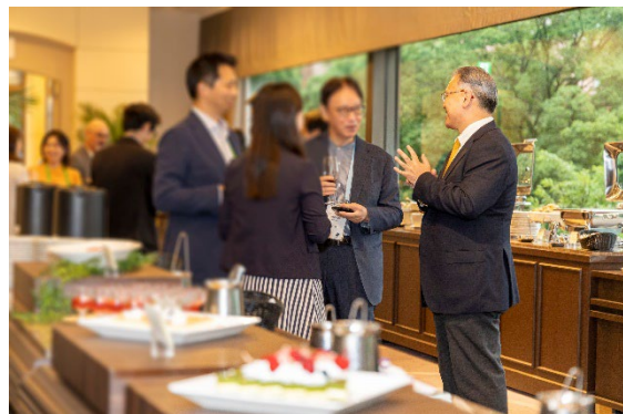
参加者は国内外から招聘された登壇者とネットワーキングで直接交流できる