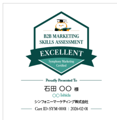
エクセレントバッジ（見本） / 通称：ミミズクバッジ

新たなレポート項目として「グレード」を設定しました。「5 つのスキルバランス」および「13 のスキル別カテゴリ偏差値」に加え、全設問に対する正答率を 5 段階のグレードとして提示します。さらに、偏差値が高い受検者の中でもより優秀な層を可視化するため、高いグレードを表すエクセレントバッジを進呈します。