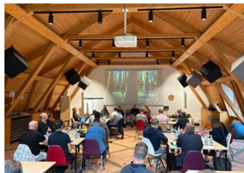
世界各国のエージェンシーが集いディスカッションと交流を実施

私は 2025 年 10 月にフランクフルト郊外の古城で 4 日間にわたって開催された BBN のアニュアルジェネラルミーティング（AGM）に参加してきました。