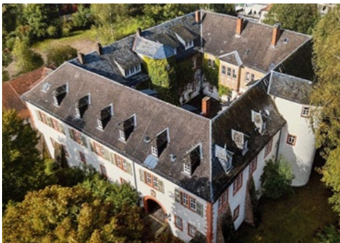
AGM 会場となったドイツ・フランクフルトの古城

2017 年から私は世界を網羅したマーケティングエージェンシーネットワークの理事を務めていました。しかし、デマンドジェネレーションのテクノロジーや AI の劇的な進化を受けて、さらに専門性の高いネットワークに移るべきだと考えました。BBN は昔から知っている BtoB マーケティングに特化したグローバルネットワークであり、BtoB マーケティングサービス企業としても世界で第 3 位の実績を持っています。